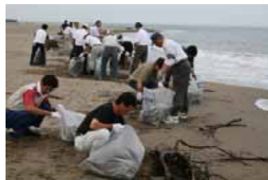
7/12 海岸清掃例会 「根上地区 山口海岸」にて