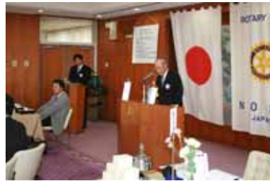
7/4 長高会長就任挨拶