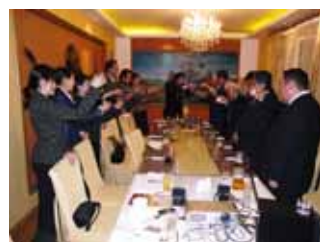
9/30 ニーセル RC 例会出