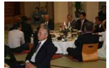
10/10 観月例会 たがわ龍泉閣にて