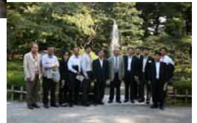
10/10 釜山南川 RC 会員来日