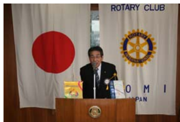
7/29 納涼例会 「わくわく手づくりファーム」