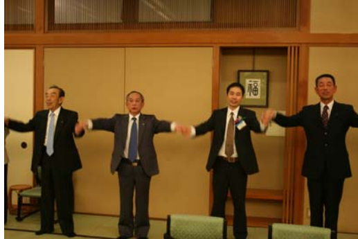
10/20 釜山南川RC会員観光「福井市内」