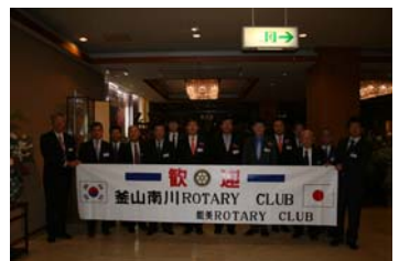
10/19 観月例会 辰口温泉「たがわ龍泉閣」於