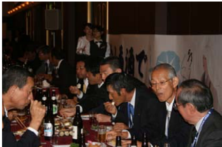
10/5 地区大会 大懇親会 (ホテルニューオータニ高岡)