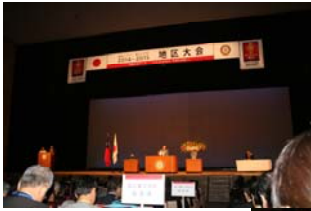
10/5 地区大会 本 会 議 (高岡市民会館)