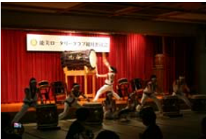
九谷太鼓若獅子組の皆さん