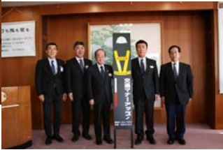
ポリス看板一式目録贈呈