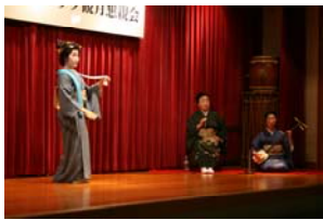
山中温泉芸妓連の皆様