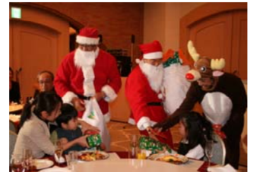
サンタさんの登場