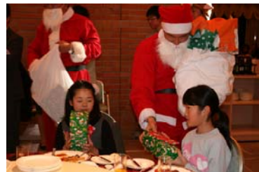
クリスマス プレゼントは？