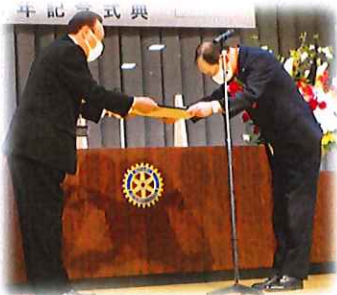
川北町支援事業に対する町長からの感謝状