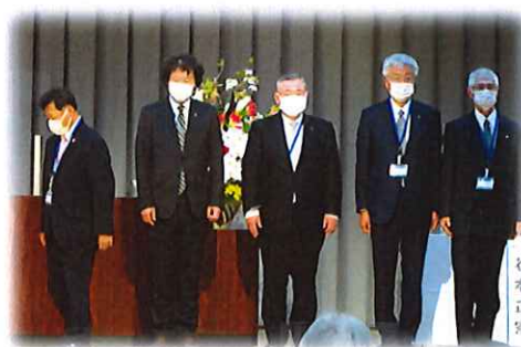
歴代幹事顕彰5名の皆様