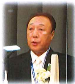
元山会長よりご臨席の皆様のご紹介と会長挨拶