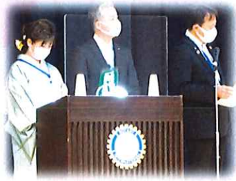
中野記念事業委員長からの事業報告