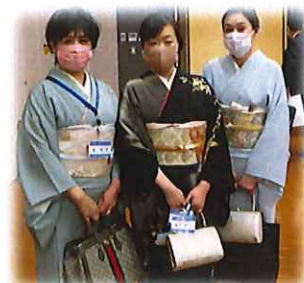
会長夫人、実行幹事夫人、 そして司会で大活躍した南会員、華やかです！