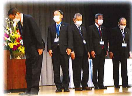
歴代会長顕彰5名の皆様