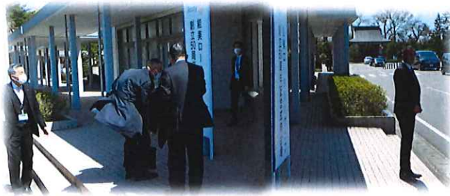
ご来場の皆様をお出迎え！