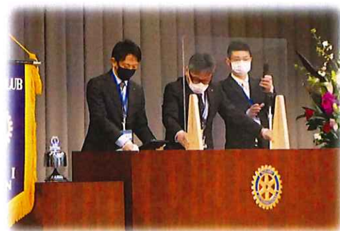
勿論、記念講演・記念式典内では常に、アクリル板、マイク、マスク置きの交換と消毒を徹底！