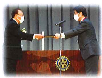
能美市支援事業による井出市長からの感謝状