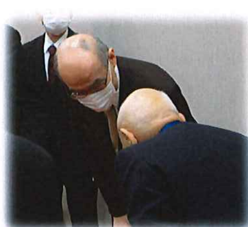
百寿の原田会員へ谷本知事より激励

コロナ禍にも関わらず無事に式典が開催できましたのも、ご来場頂きました皆様方のご理解、そして会員の皆様のご協力のお陰です。皆様には「感謝！感謝！」です。