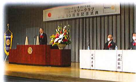
八塚地区ガバナーご挨拶