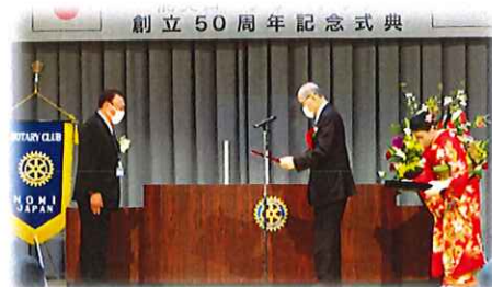
石川県支援事業に対する谷本知事からの感謝状