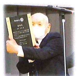
今年百寿を迎えた原田会員 (長寿ロータリアン)