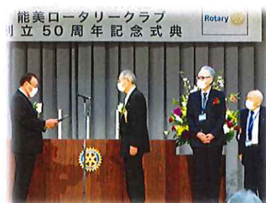
クラブ特別功労表彰3名の皆様