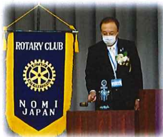
元山会長による開会点鐘