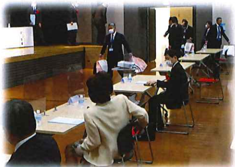
閉会点鐘後はアナウンスと同時に記念品をお席へ