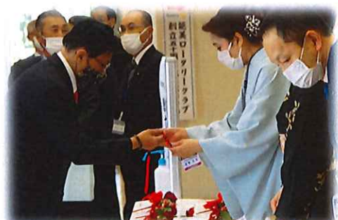
エントランスでは「検温」の実施、そして受付では「消毒」の実施と大忙し、ご来場の皆様に感謝です！