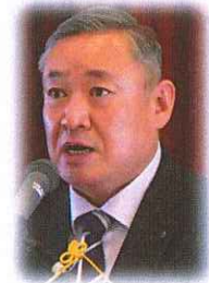
小坂記念式典委員長