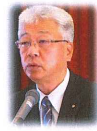
秋田友好クラブ委員長