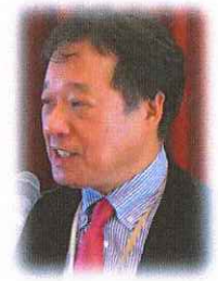
中野記念事業委員長