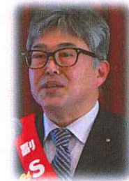
広瀬姉妹クラブ委員長