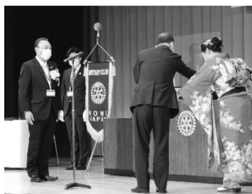
「袁さん(米山学友)、アインさん(米山奨学生)、介添え頑張りました！」