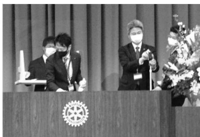
「連携プレーでコロナ対策」