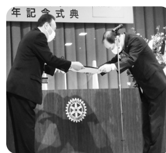
【前川北町長より感謝状授与】