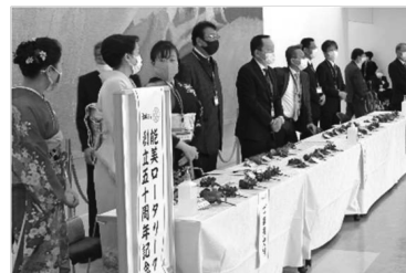
「さあ、ご来場の皆様をお出迎え」