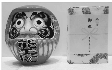
「高崎南RCよりお祝いを頂きました！」