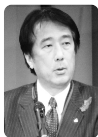
【井出敏朗能美市長】