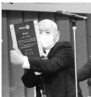
「谷本石川県知事より原田会員へ直々に激励のお言葉を頂きました」