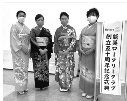
「着物姿は会場を華やかに！」