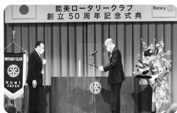
【谷本石川県知事より感謝状授与】