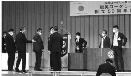
「リハーサルで最終チェック」