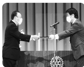
【井出能美市長より感謝状授与】