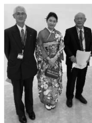
「カウンセラーと奨学生」