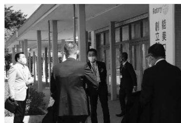
「いよいよお出迎えです！」