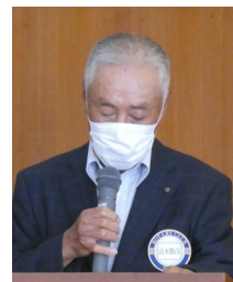
清水直前会計監査監事