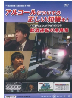
地域のドライバーの皆様へ