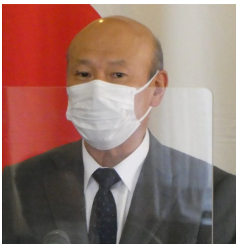
松崎署長より基調な卓話を頂戴致しました! 有難うございました!