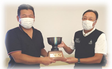
第122回優勝者 和泉会員