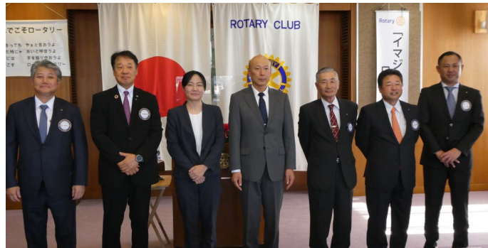
松崎署長、窪交通課長、本日はお忙しい中、能美RC例会にお越し頂き、会員一同心より感謝しております!