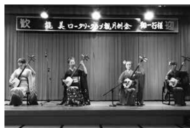
美奏塾の皆様による津軽三味線