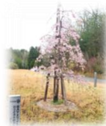
昨年創立50周年を記念して植樹した枝垂れ桜も満開になりました！